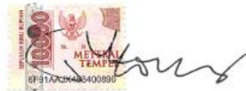
Tri Purno Utomo